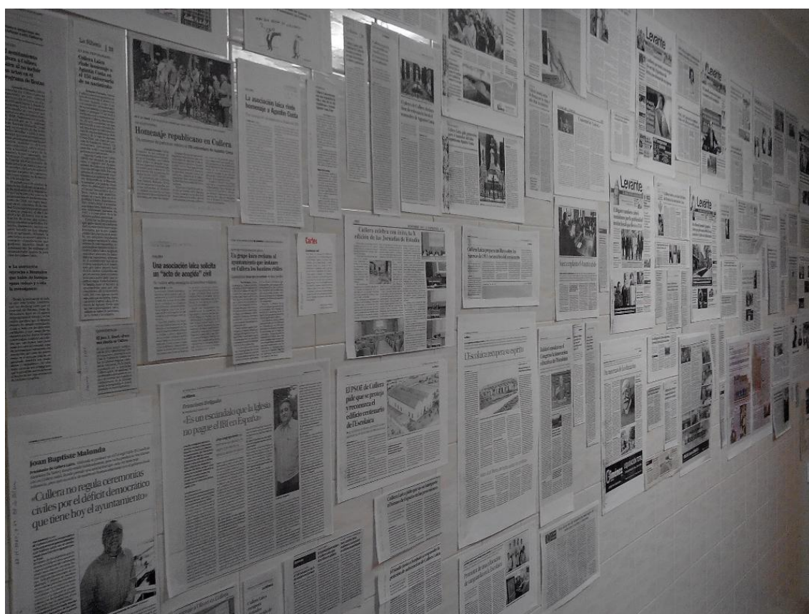
Detall de l'exposició "Cullera Laica: 10 anys amb el laïcisme i la llibertat de consciència". (22-30 d'abril de 2017, seu de Cullera Laica).

Des de la seua fundació, Cullera Laica ha sigut notícia en un centenar d'ocasions distintes i en més d'una vintena de mitjans de comunicació distintos (escrits, radiofònics, televisius i digitals), arran de comunicats de l'Associació, declaracions dels seus responsables, entrevistes als presidents, reportatges, etc. Almenys, que sapiguem, Cullera Laica ha sigut notícia en: CADENA SER, CANAL PARLAMENTO, CULLERA TV, DIARI LA VEU, EL PERIÒDIC, EL SEIS DOBLE, EL TEMPS, INFORMACIÓ DE LA RIBERA, LAICISMO.ORG, LA MAREA, LAS PROVINCIAS, LEVANTE, L'EXPRESSION, QUINZE DIES, RÀDIO CULLERA, RIBERA EXPRESS, RIBERA NOTÍCIES, SALVA LA VEU DEL POBLE, SINTONÍA LAICA, TELE CULLERA I TOT CULLERA.