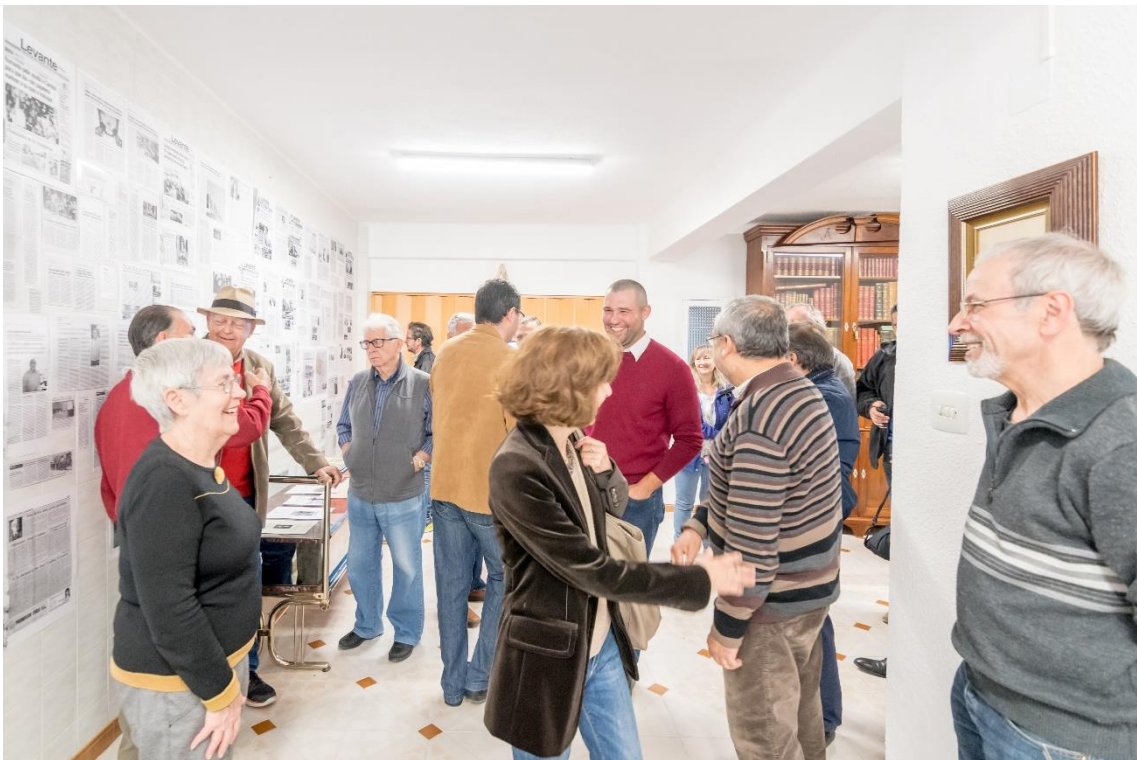
Instantània de l'acte d'inauguració de la seu i de l'exposició dels 10 anys de Cullera Laica. 22 d'abril de 2017.

La valoració dels 10 anys de l'Associació que fa la Junta directiva de Cullera Laica és tant positiva com negativa. És positiva per la finalitat de l'Entitat, per les iniciatives que hem plantejat, pels actes que hem realitzat, per les publicacions que hem llançat, pels béns patrimonials aconseguits, pel ressò mediàtic tingut, pel premi, pel símbol... Una persona, gens sospitosa de tindre plantejaments molt laïcistes, va dir: "si Cullera Laica no existira, hi hauria que inventar-la". I com eixa, ens han arribat altres declaracions, verbals i escrites, que ens fan sentir satisfets pel treball desenvolupat.