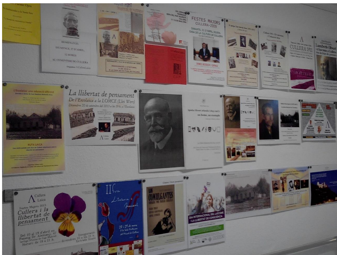
Detall de l'exposició "Cullera Laica: 10 anys amb el laïcisme i la llibertat de consciència". (22 d'abril de 2017, seu de Cullera Laica).

Des de la seua fundació, Cullera Laica ha organitzat, participat o col·laborat en més de 50 actes públics; sobre laïcitat, educació, història, ciència... i en diferents formats: conferències, concursos, audiovisuals, exposicions, rutes... A continuació segueix una relació dels actes realitzats per Cullera Laica, ordenats cronològicament, amb indicació del lloc de Cullera i del mes i any en què es van celebrar. Si no s'especifica altra cosa, l'acte referit ha estat organitzat exclusivament per Cullera Laica.