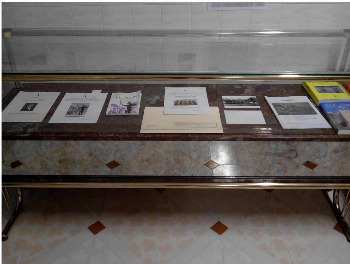
Detall de l'exposició "Cullera Laica: 10 anys amb el laïcisme i la llibertat de consciència". (22 d'abril de 2017, seu de Cullera Laica).

Des de la seua fundació, Cullera Laica ha realitzat més d'una dotzena de publicacions i audiovisuals, quasi tot vinculat als actes de Festes Majors organitzats per l'Entitat. A continuació segueix una relació amb una breu explicació de tot este material, ordenada cronològicament: