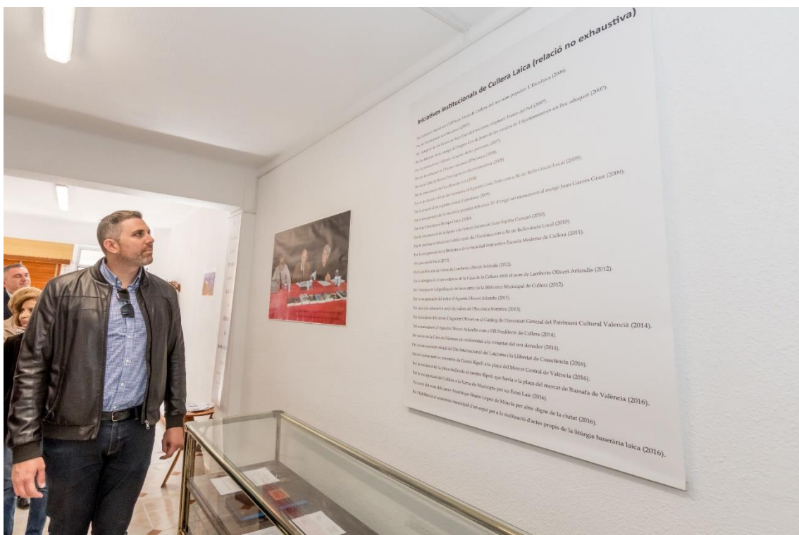
L'alcalde de Cullera, Jordi Mayor, en l'acte d'inauguració de la seu i de l'exposició dels 10 anys de Cullera Laica. 22 d'abril de 2017, seu de Cullera Laica.

A continuació segueix una relació de les iniciatives institucionals de Cullera Laica, ordenades cronològicament, amb indicació de l'any en què es van iniciar. A la nostra web es pot trobar més informació: