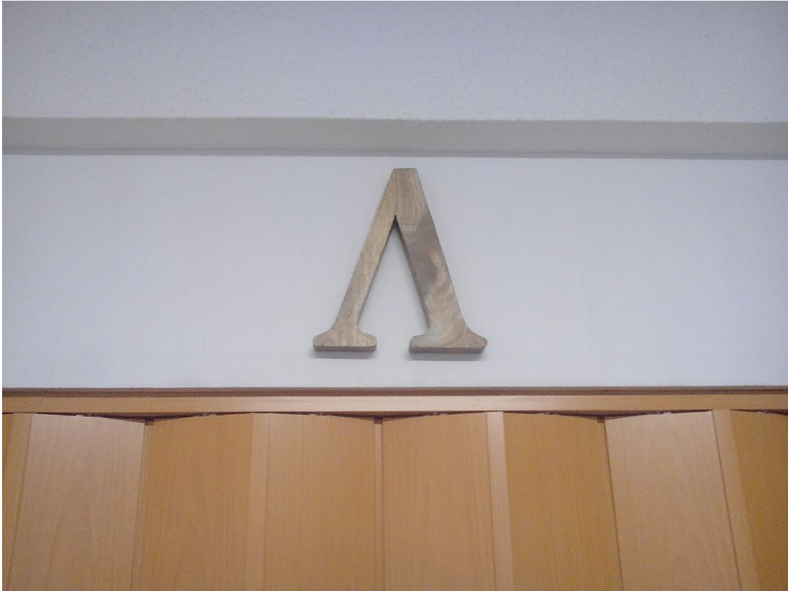
La lambda, símbol de Cullera Laica. (Detall de la seu de Cullera Laica).